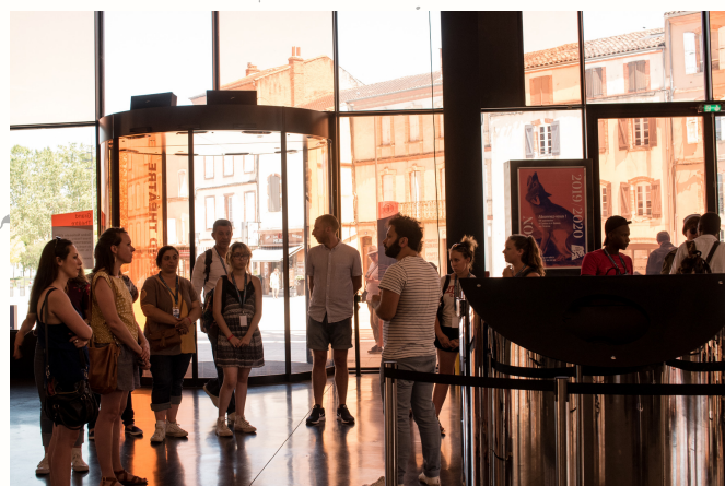
Visite du Grand Théâtre d'Albi